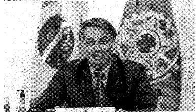
PRESIDENTE brasileiro rebateu declaração do candidato democrata

Em reação à fala do candidato norte-americano Joe Biden sobre a Amazônia, o presidente Jair Bolsonaro (sem partido) afirmou que a declaração foi "gratuita e desastrosa". Nas redes sociais, Bolsonaro, em português e inglês, disse que a soberania brasileira é "inegociável" e avaliou que a declaração sinaliza "clareamente abrir mão de uma convivência cordial e profunda" entre os países.